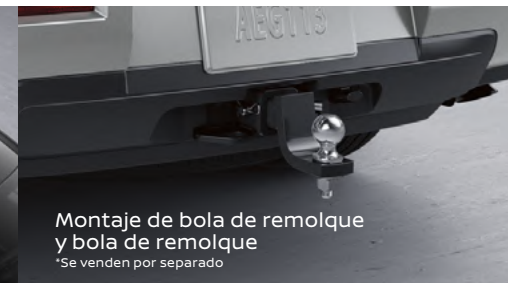
Montaje de bola de remolque y bola de remolque *Se venden por separado