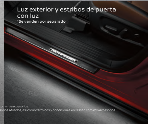
Luz exterior y estribos de puerta con luz *Se venden por separado

Imágenes de referencia. Los accesorios mostrados pueden venderse por separado. Consulta especificaciones, versiones y equipamientos disponibles para México en Nissan.com.mx/accesorios. *Los Accesorios Afiliados son aquellos cuya garantía es otorgada directamente por el fabricante del accesorio y no por Nissan Mexicana, S.A. de C.V. Consulta el listado de Accesorios Afiliados, así como términos y condiciones en Nissan.com.mx/Accesorios